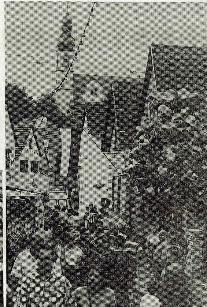
Zahlreiche Besucher werden an den Festtagen auf der Weinmeile am Fuße der St. Gereonskirche erwartet.